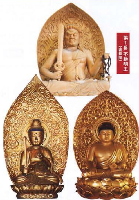
第1番 不動明王 (宗福院)

このありがたい十三仏さまとのご縁を結ぶため、多くの善男善女がみちのく出羽路・山形十三仏を巡礼されています。各霊場は、松尾芭蕉の『五月雨をあつめて早し最上川』で有名な最上川沿いに、南は山形県山形市から北は秋田県境近くの真室川町までいずれも山紫水明の地に点在しています。由緒ある寺々をめぐり、季節の花々にこころを和ませ、また、いにしえの人々の遺した文化財を味わいながら、みほとけに手を合わせてください。こころは清く澄みわたり、先祖供養はもちろんのこと諸願成就して、より一層充実した明日の生活が築かれますことをご祈念申し上げます。