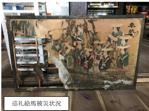
巡礼絵馬被災状況

これらの教訓から、 文化財の普段の保管場所や、被災時の避難場所、被災状況の確認とその後の対応 について、 詳細に制度化し、迅速な復旧を実施 する必要がある。